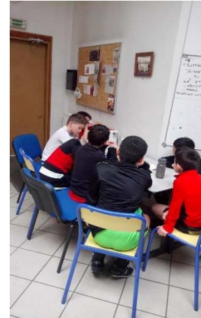
Groupe Douche, Hydratation