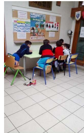
Groupe Sac de foot