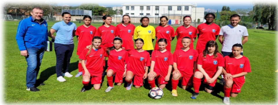
Ci-dessus le groupe U14F/U13F lors du RID d'Avril 2022

Le Rassemblement Inter-Districts U14F a eu lieu en Avril 2022 avec une 2nde place pour le District de l'Isère et une génération intéressante pour les années futures.