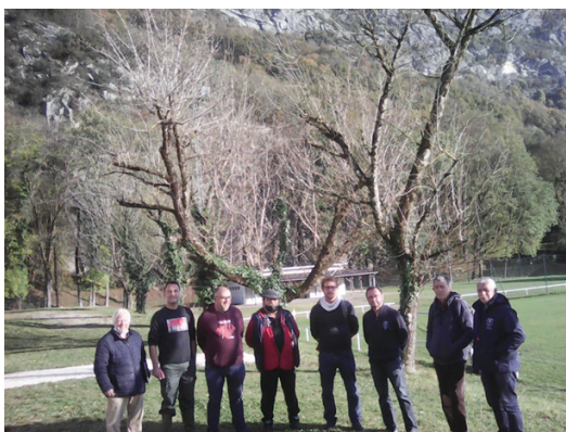
Photo ci-dessous avec le Président CRTIS, les membres de la CDTIS avec les élus de la collectivité et des représentants du club lors d'une visite pour le classement d'une installation sportive.

Les décisions de classement avec le rapport de visite sont transmises au propriétaire.